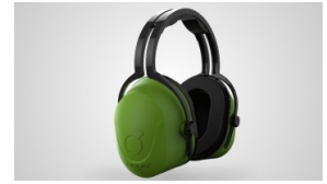
L-360 - HI-VISIBILITY Protector auditivo externo Modelo Vincha – NRR 29 dB- SNR 32 dB