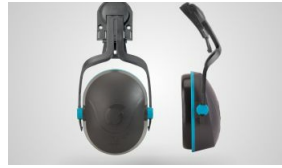
L-320 P/CASCO Protector auditivo Externo Modelo Casco – NRR 19 dB- SNR 20 dB