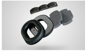
KIT REPUESTO L340 VINCHA Recambio modelo Vincha L-340